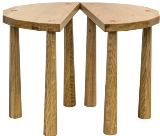
Elise FOUIN - Tabourets