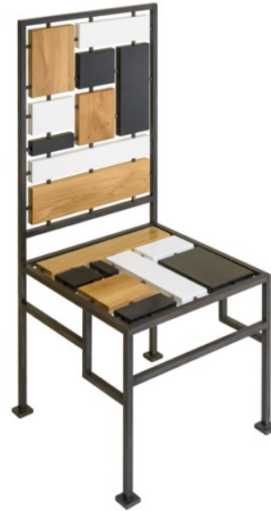
Elisabeth GAROUSTE - Chaise Mondrian

Designer emblématique des années 80, Elizabeth Garouste évolue tout d'abord entre aménagement de décors et d'intérieurs et conception de mobiliers ou d'objets fabriqués industriellement. Passionnée par les arts décoratifs, Elizabeth Garouste crée de nombreux aménagements et du mobilier, collabore avec Christian Lacroix comme avec Nina Ricci, Ricard, ou encore Christian Louboutin ... avant de se consacrer exclusivement à l'art. Dès les années 1980, Elizabeth Garouste développe un univers iconique aux matériaux inattendus, édité par les galeries Avant-scène, En attendant les Barbares, Mouvement Moderne et la Granville Gallery notamment. Sa liberté de création est saluée par de nombreux musées et centres d'art et a fait l'objet de plusieurs commandes publiques. Son travail a fait l'objet de nombreuses présentations dans les plus grandes galeries et musées, en France comme à l'international.